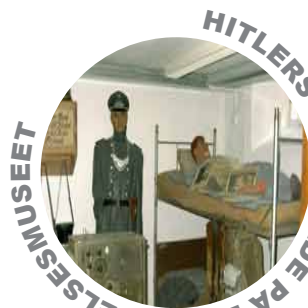
HITLERS OLYMPIADE PÅ BESÆTTELSESMUSEET