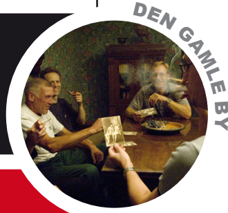
DEN GAMLE BY